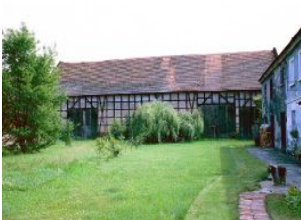
Zdjęcie nr 8