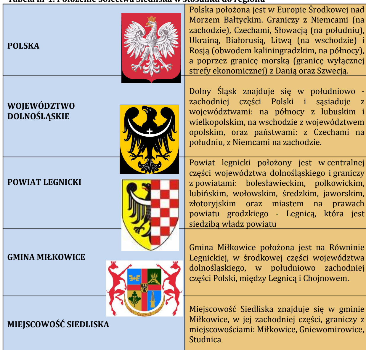
Tabela nr 1. Położenie Sołectwa Siedliska w stosunku do regionu

Sołectwo - Siedliska objęte niniejszym Planem należy do gminy Miłkowice, leżącej w powiecie Legnickim województwa dolnośląskiego. Znajduje się w jego zachodniej części i graniczy z miejscowościami: Miłkowice, Gniewomirowice, Studnica. Powiat legnicki położony jest w środkowej części województwa dolnośląskiego i graniczy z powiatami: bolesławieckim, polkowickim, lubińskim, wołowskim, średzkim, jaworskim, złotoryjskim oraz miastem na prawach powiatu grodzkiego - Legnicą, która jest siedzibą władz powiatu.