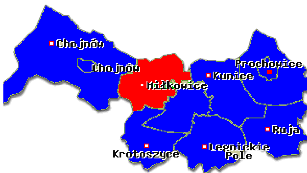
Mapa 1 Powiat legnicki