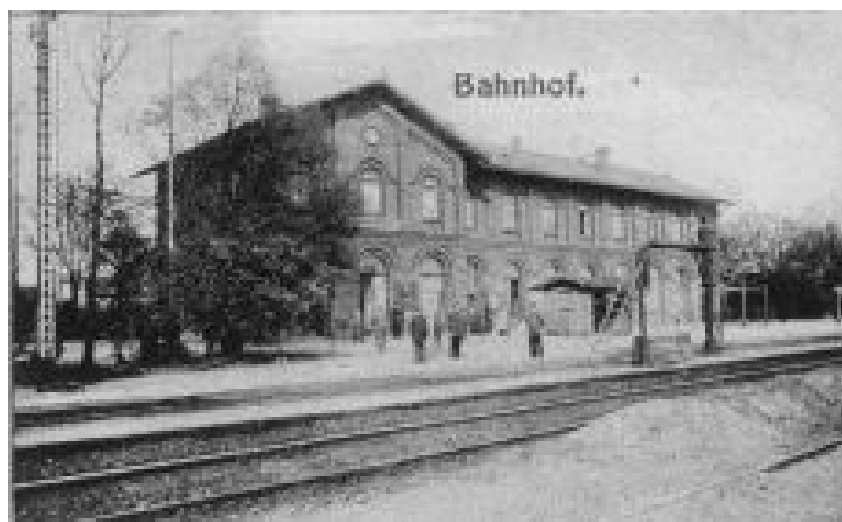
Zdjęcie 5 Budynek Dworca Kolejowego 1/4 kartki pocztowej (ok. 1910 r.)

Na uwagę zasługują również bogato zagospodarowane parki przypałacowe w Jakuszowie i Kochlicach.