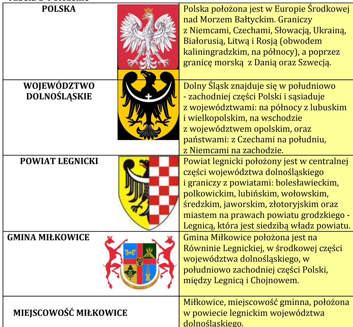
Tabela 1 Położenie

Powiat legnicki graniczy z powiatami: bolesławieckim, polkowickim, lubińskim, wołowskim, średzkim, jaworskim, złotoryjskim oraz miastem na prawach powiatu grodzkiego - Legnicą, która jest siedzibą władz powiatu.