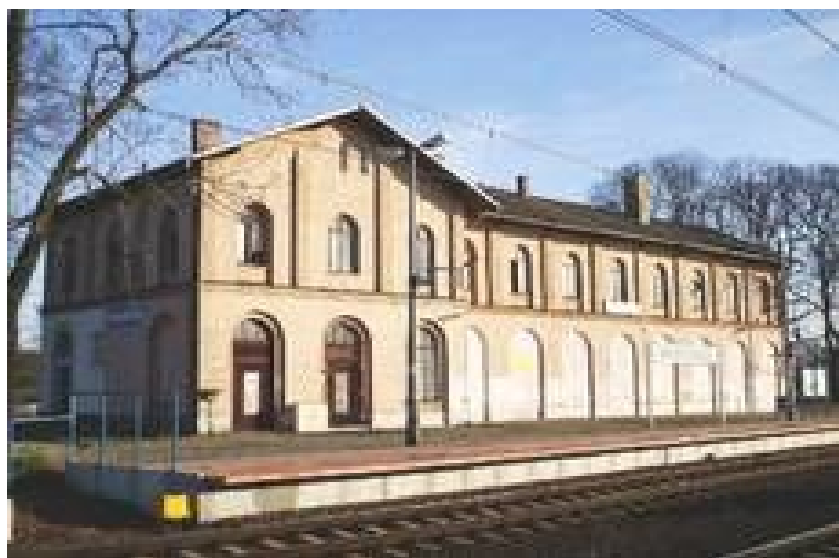
Zdjęcie 6 Budynek Dworca Kolejowego - w chwili obecnej