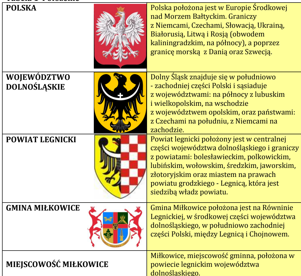
Tabela 1 Położenie

Powiat legnicki graniczy z powiatami: bolesławieckim, polkowickim, lubińskim, wołowskim, średzkim, jaworskim, złotoryjskim oraz miastem na prawach powiatu grodzkiego - Legnicą, która jest siedzibą władz powiatu.