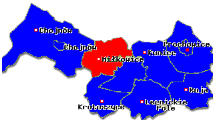
Mapa 1 Powiat legnicki