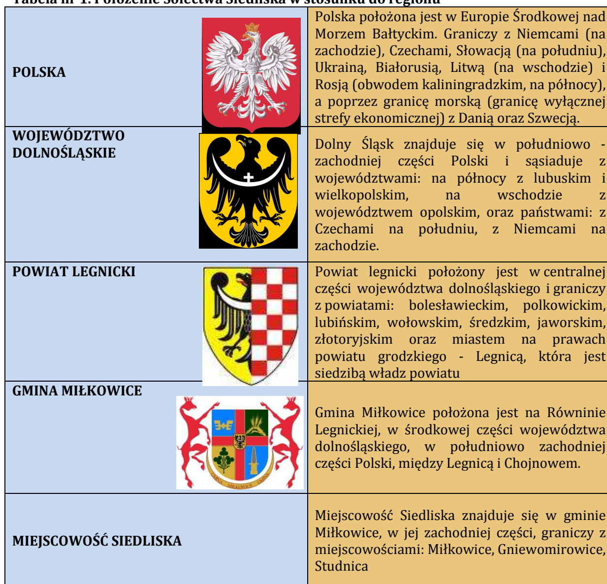
Tabela nr 1. Położenie Sołectwa Siedliska w stosunku do regionu

Sołectwo - Siedliska objęte niniejszym Planem należy do gminy Miłkowice, leżącej w powiecie Legnickim województwa dolnośląskiego. Znajduje się w jego zachodniej części i graniczy z miejscowościami: Miłkowice, Gniewomirowice, Studnica. Powiat legnicki położony jest w środkowej części województwa dolnośląskiego i graniczy z powiatami: bolesławieckim, polkowickim, lubińskim, wołowskim, średzkim, jaworskim, złotoryjskim oraz miastem na prawach powiatu grodzkiego - Legnicą, która jest siedzibą władz powiatu.